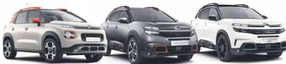
C3 AIRCROSS SUV