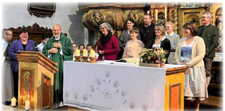
Text und Foto: Pfarre Bad Wimsbach-N.

So konnte das Erntedankfest und die Beauftragungsfeier noch gemütlich ausklingen.