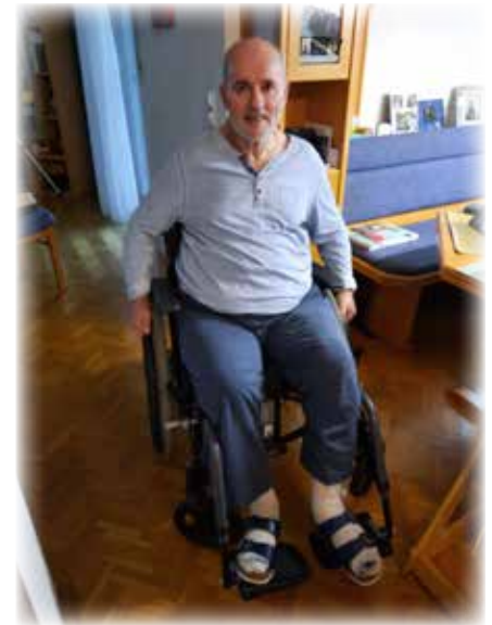
Text: kfb, Foto: privat

AT42 3475 0000 0007 8212 einzahlen. Ebenso liegen Zahlscheine auf den örtlichen Banken auf. Danke!